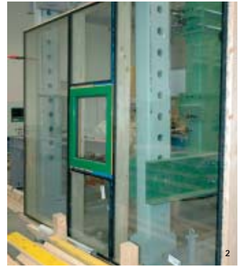
1 und 2 Konstruktionsprinzip des Holz-Glas-Verbundelementes und erste Versuche damit als Fassadensystem am Bauteilprüfstand