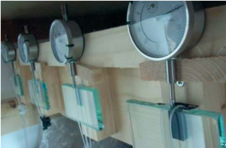
3 Untersuchung des Kriechverhaltens der elastischen Klebstoffe

langzeitliche Belastungen sowie das Alterungsverhalten bringen. Ein zentraler Punkt ist auch die Charakterisierung des Verbundelementversagens. Am Ende dieses Forschungsprozesses steht die