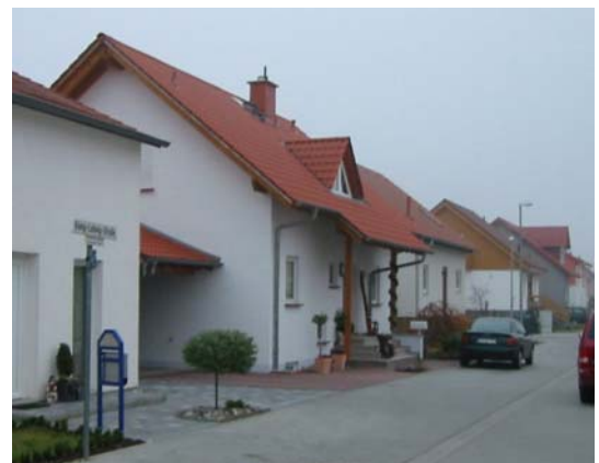
Einfamilienhaus mit Standarddämmwerten

Architekt Passivhaus: faktor 10, Folkmer Rasch und Petra Grenz, Darmstadt